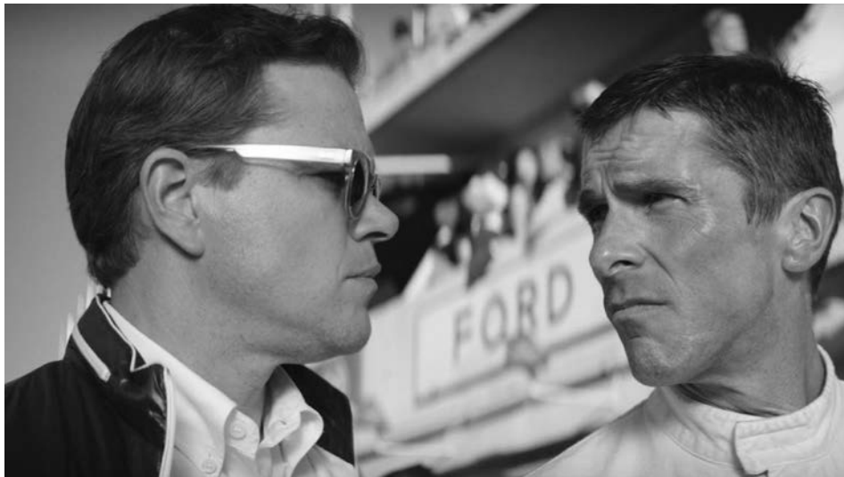
Matt Damon et Christian Bale, une équipe de vainqueurs

Le Mans 66 , également connu sous le titre américain Ford vs Ferrari , est un film biographique et d'action réalisé par James Mangold. Il retrace l'histoire vraie de la rivalité entre les constructeurs automobiles Ford et Ferrari dans les années 1960, mettant en lumière la bataille pour la suprématie lors des 24 Heures du Mans.