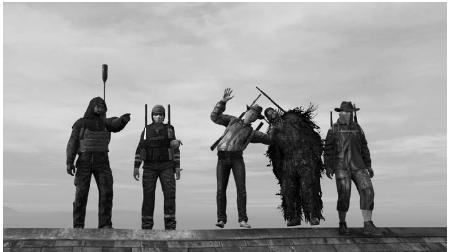
A la rencontre de Reverend Stone, Slugmite, Macro, Feesh, Chill pilgrim, Iris, René...

Nous suivons les personnages qu'il·elles se sont créés, leurs discussions, soit en rapport avec le jeu soit avec la vie réelle. Leur amitié perdure, même après plusieurs mois sans connexion.